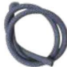
WATER OUTLET HOSE MANGUERA DE DESAGÜE