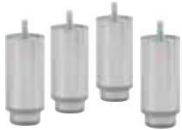
4 HEIGHT ADJUSTABLE LEG KIT KIT 4 PATAS ALTURA REGULABLE